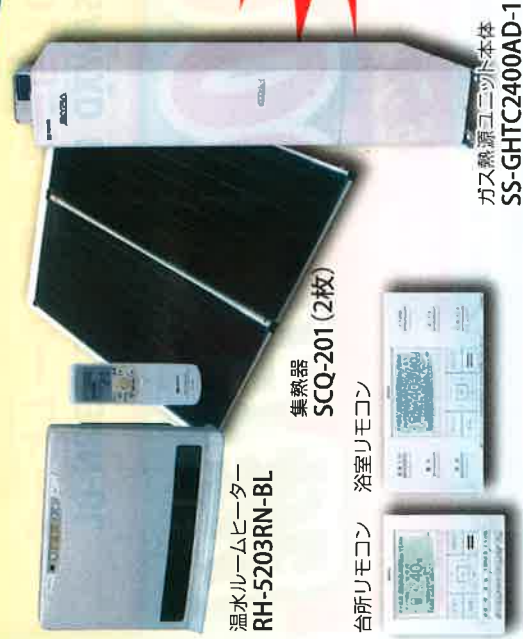
温水ルームヒーター RH-5203RN-BL